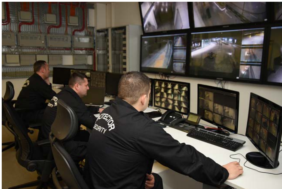
Slika br.1 - Tehnički sistem zaštite

Tehnički sistemi zaštite predstavljaju naučnu disciplinu u kojoj najbrže nalaze svoju primenu najnovija tehnička i tehnološka dostignuća (slika br. 1).