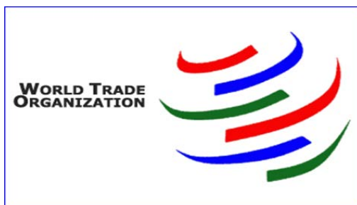
Ilustracija 1. Grb Svetske trgovinske organizacije

Pored toga, STO vrši nadzor nad nacionalnim trgovinskim politikama, uspostavlja mehanizam zaštite, pravila i propise međunarodnog trgovinskog sistema, te predstavlja forum za bilateralne i multilateralne pregovore. Uz to, za razliku od GATT-a koji je usklađivao stavove sa međunarodnim finansijskim organizacijama o merama koje se uvode iz platnobilansnih razloga, STO postaje deo usklađenog delovanja na planu uspostavljanja trgovinske, makroekonomske, privredno-sistemske i razvojne funkcije u sklopu dalje globalizacije svetske privrede.