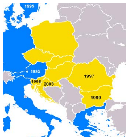
Ilustracija 3: stanje uz 2003

Trgovinska razmena među zemljama CIE se, od 1989. do 1993.godine, povećala sa 8% na svega 13%, dok je u istom periodu, EU ili bolje reći Nemačka, postala njihov najveći trgovinski partner. Učešće EU u ukupnom izvozu CIE se povećalo sa 1/3 na 60%, a sama Nemačka sa 11 na 29%, što čini preko 50% ukupnog uvoza EU iz ovog regiona. Nadalje, u periodu od 1993. do 2000.godine ukupan izvoz zemalja CIE se više nego udvostručio, povećavajući učešće EU u njihovom ukupnom izvozu na oko 65%. Zanimljivo je pomenuti da "Luksemburška grupa" (prva grupa kandidata za članstvo u EU: Češka, Poljska, Mađarska, Slovenija, Estonija, uključujući i Kipar) trguje mnogo više sa EU od "Helsinške grupe" (Bugarska, Letonija, Litvanija, Rumunija, Slovačka, uključujući u Maltu). Prva grupa je 1998.godine uvozila 71%, a izvozila 67% u EU, što govori u prilog da su neke zemlje iz ove grupe mnogo više integrisale u EU, u smislu trgovine, nego neke članice. Helsinška grupa je uvozila 50%, a izvozila 59% u EU, u istom periodu.