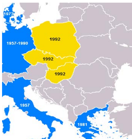
Ilustracija 4: osnivanje 1992